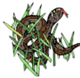
Snake in the grass