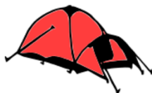
Tienda de campaña