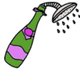
Ducha de champán